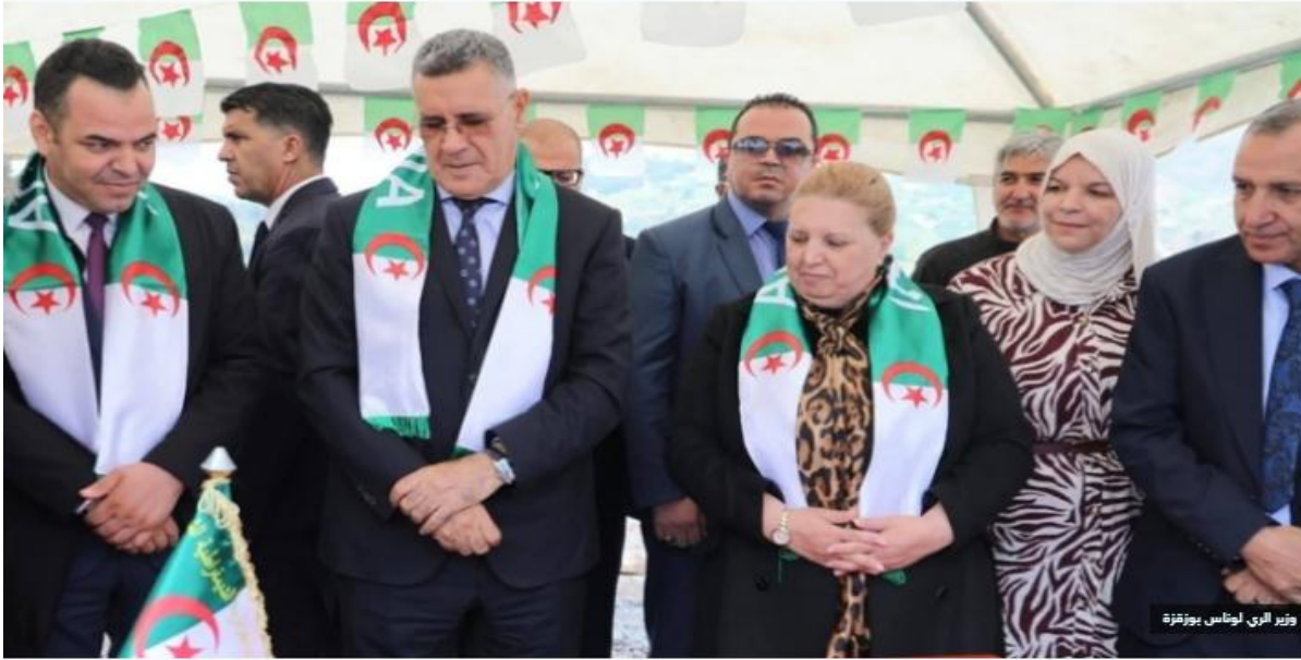
وزير الري لونس بوزقزة

أكد وزير الري لونس بوزقزة، أول أمس، بالجزائر العاصمة، على تعزيز التنسيق والمتابعة الميدانية بين مختلف الهيئات بما يضمن جاهزية القطاع عبر كامل التراب الوطني لضمان خدمة عمومية جيدة تحسبا لعيد الاضحى وموسم الاصطياف 2026، حسب ما أفاد به بيان للوزارة.